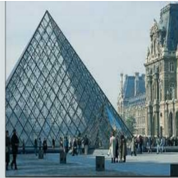
Le Louvre et la pyramide du Louvre

Sous l'Empire, le Louvre est devenu le Musée Napoléon. Napoléon y apportait les trésors d'art qu'il avait saisis o au cours de ses campagnes à travers o l'Europe. Plus tard, le Louvre s'est enrichi